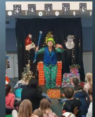
Fête de fin d'année 2023