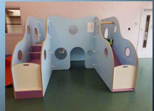
Toboggan espace de vie moyens/grands

L'aménagement de la pièce de vie est pensé pour que l'enfant puisse jouer librement, développer son autonomie, son imaginaire, sa créativité. Un espace cuisine, un espace motricité avec un toboggan et des modules, un espace voitures, un espace graphisme, un espace construction et un espace ressourcement avec des tapis coussins et fauteuils ont été aménagés que chaque enfant peut investir et explorer à sa manière et à son rythme. Pour 2025/2026 nous souhaitons mettre en place un espace manipulation en plus.