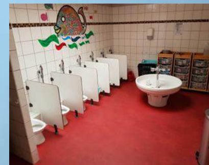
Espace de change / WC

Nous encourageons chaque enfant à aller chercher ses vêtements dans son panier personnalisé et à faire seul, nous lui montrons comment faire et lui proposons notre aide s'il a besoin. Certains enfants ne veulent pas, alors il n'est pas nécessaire d'insister, parfois il a juste besoin que l'on s'occupe de lui.