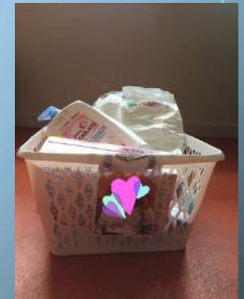
Panier de change individualisé