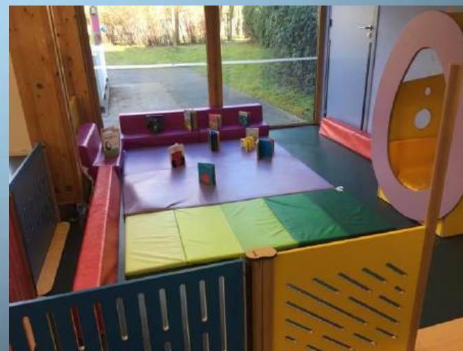
Zoom sur l'espace ressourcement salle de vie moyens/grands

Le mobilier de la crèche est sélectionné avec soin auprès de fournisseurs spécialisés Petite Enfance. En effet, ce choix nous apporte la garantie de matériaux de qualité, une sécurité optimale et du mobilier parfaitement adapté et confortable pour les enfants et les professionnels.