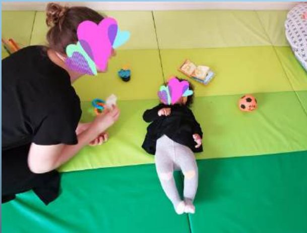
Laisser l'enfant se mouvoir librement

« La motricité libre », un concept essentiel à notre pratique qui consiste à laisser libre cours à tous les mouvements spontanés de l'enfant. C'est-à-dire qu'on ne place pas un enfant dans une position qu'il n'a pas acquis par lui-même (par exemple on ne le met pas assis, s'il ne se met pas assis seul, de même les transats sont utilisés avec parcimonie : pour la digestion par exemple). Ainsi on respecte son rythme et les étapes de son développement psychomoteur.